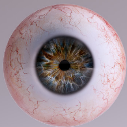
Pupilas contraídas o pequeñas

Hay síntomas específicos que indican una posible sobredosis por opiáceos. Esta se puede identificar por una combinación de tres signos y síntomas denominada "tríada de sobredosis por opiáceos".