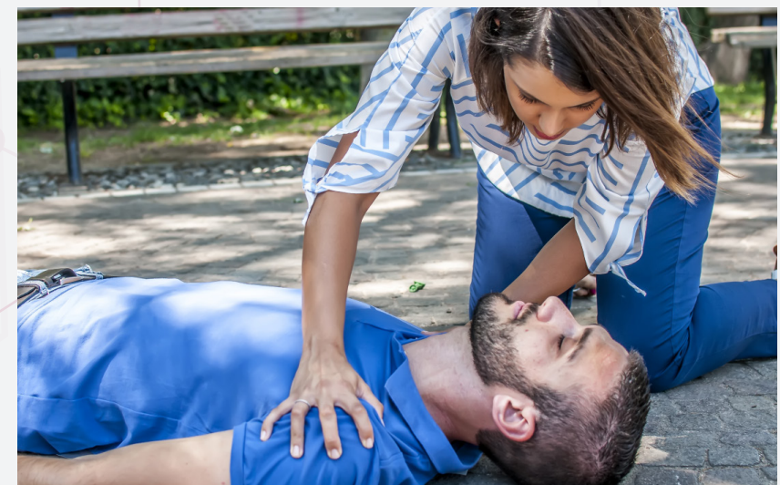
Persona no responde

◆ Otros síntomas pueden ser: uñas/labios violeta y cuerpo flojo.