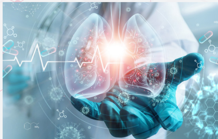
Problemas para respirar