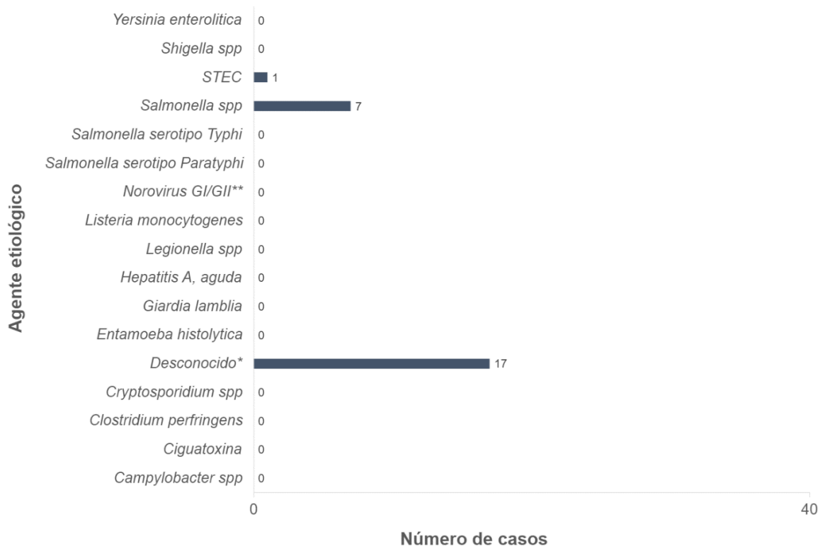
Gráfica 4. Incidencia acumulada de Enfermedades Transmisibles por Alimentos y/o Agua según el agente etiológico, semana epidemiológica 4, 2023 (N=25)

Nota: Datos obtenidos de National Electronic Disease Surveillance System (NEDSS) Base System (NBS). *Reportado como intoxicación alimentaria y/o gastroenteritis. **Casos corresponden a brote clasificado como brote por Norovirus según los criterios de Kaplan et al. (1982).