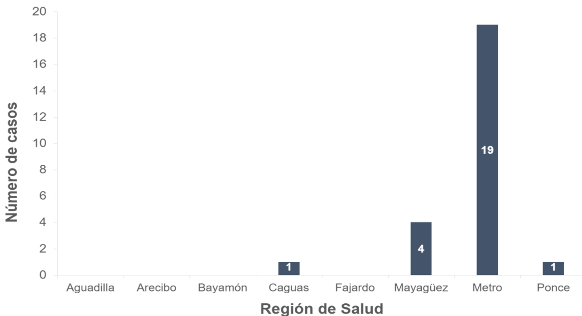
Gráfica 3. Distribución de incidencia acumulada de Enfermedades Transmisibles por Alimentos y/o Agua por región de salud, semana epidemiológica 4, 2023 (N=25)

Nota: Datos obtenidos de National Electronic Disease Surveillance System (NEDSS) Base System (NBS).