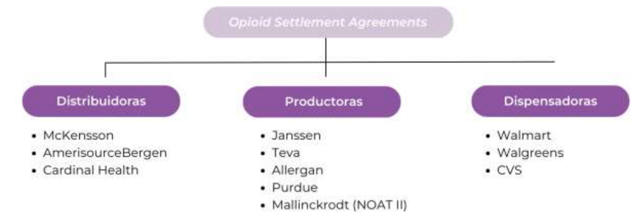
Diagrama de los litigios multidistritales de los cuales Puerto Rico se encuentra participando.

Según estipulado en las resoluciones legales del Distributor Settlement Agreements y la Janssen Settlement Agreements , los fondos asignados a Puerto Rico se dividen en tres partidas (ver Figura 2 ): un State Fund (15% de los fondos), dirigido al uso del Estado y administrado por el Departamento de Salud de Puerto Rico; un Abatement Accounts Fund (70% de los fondos), bajo la recomendación del Comité Asesor del Fondo de Recuperación y Restitución por Opioides; y un Subdivision Fund (15% de los fondos) a ser distribuido por el administrador del fondo, directamente a los municipios