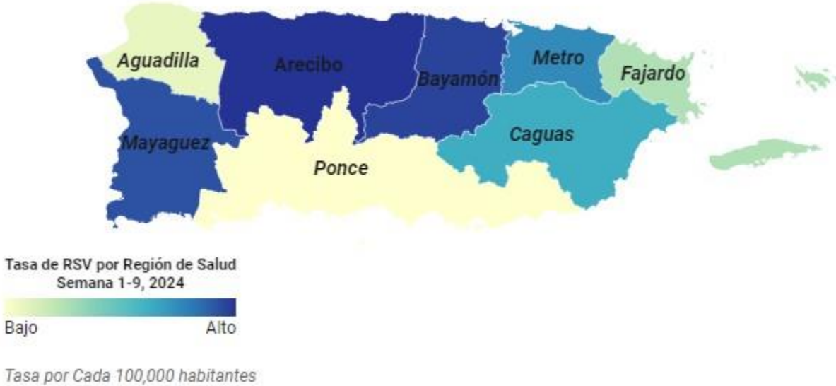
Figura 2: Mapa: Tasa de Incidencia acumulada de casos por región de Salud, Puerto Rico, año 2024

La Tabla 3 presenta las variables descriptivas de los casos acumulados de VRS para las semanas epidemiológicas 1- 9 del año 2024. La variable sexo tiene mayor frecuencia de enfermedad en hombres con un 58% . En la variable de grupo de edad, el mayor porcentaje de casos se observa en el grupo de edad <1 año con 39% . Respecto a la variable de hospitalización durante este período hubo 60 casos hospitalizados, para un 31% de los casos reportados. Por otra parte, la prueba diagnóstica para VRS más utilizada fue la de antígeno en 71% de los casos reportados. Durante las semanas epidemiológicas 1-9, no hay fatalidades asociadas a VRS reportadas a vigilancia.