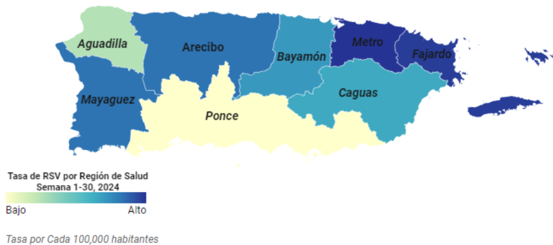
Figura 2: Mapa: Tasa de Incidencia acumulada de casos por región de Salud, Puerto Rico, año 2024

La figura 2 presenta el mapa de Puerto Rico con las tasas de incidencia acumulada de los casos de VRS por regiones de salud para las semanas epidemiológicas 1 – 30 de 2024. Las tasas de incidencia más alta se observan en las regiones de Metro ( 13.2 x 100,000 habitantes), seguido de la región de Fajardo ( 13 X 100,000 habitantes), y Mayagüez y Arecibo ( 11.8 X 100,000 habitantes), respectivamente.